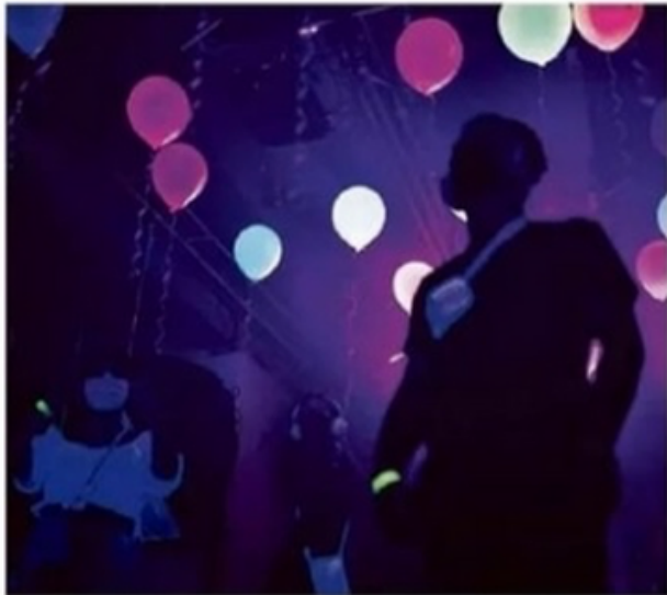
Público interage com o cenário da peça 'Fim de Festa', com direção de Fabiana Monsalú.